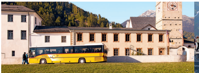
Das Kloster St. Johann in Müstair / Convento di San Giovanni a Müstair The Abbey of St. John in Müstair / Le couvent Saint-Jean de Müstair

Die Stelvio-Linie verbindet das Münstertal mit dem Veltlin. Die Fahrt von Sta. Maria über das Stilfserjoch nach Tirano kombiniert ein hochalpines Passerlebnis mit südlichem Flair.