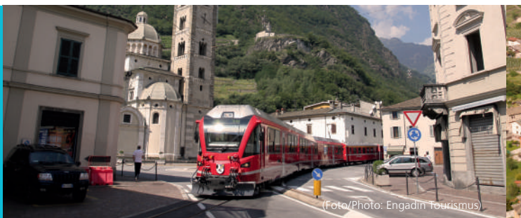
Die Rhätische Bahn mitten in Tirano / La Ferrovia retica nel centro di Tirano / The Rhaetian Railway in the middle of Tirano / Les Chemins de fer rhétiques en plein cœur de Tirano

Bekannt sind Tirano und die Umgebung für kulturelle Bauten sowie für die kulinarischen Veltliner-Spezialitäten: Wein, Trockenfleisch (Bresaola), Käse, Roggenbrot und Pizzoccheri. Hier wechseln Reisende von der Rhätischen Bahn auf das Postauto und umgekehrt.