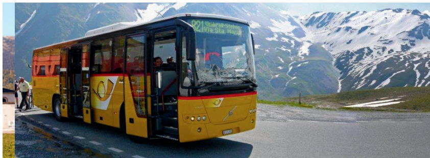
Postauto auf dem Umbrailpass / Autopostale sul passo dell'Umbrail Postbus at Umbrail Pass / Car postal au col de l'Umbrail

La linea dello Stelvio collega la Val Monastero con la Valtellina. La corsa da Santa Maria attraverso lo Stelvio con destinazione finale Tirano combina le emozioni dei passi alpini con un tocco meridionale.