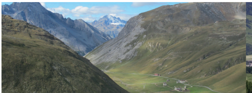
Blick vom Stilfserjoch in Richtung Bormio / Vista dallo Stelvio in direzione di Bormio View from Stilfserjoch in the direction of Bormio / Vue du col du Stelvio en direction de Bormio

The Stelvio route connects Val Müstair with the Veltlin region. The journey from Sta. Maria across the Stilfserjoch to Tirano is a high mountain pass adventure with a southern flair.