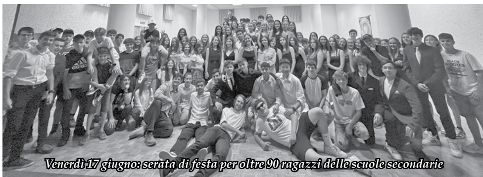
Venerdì 17 giugno: serata di festa per oltre 90 ragazzi delle scuole secondarie