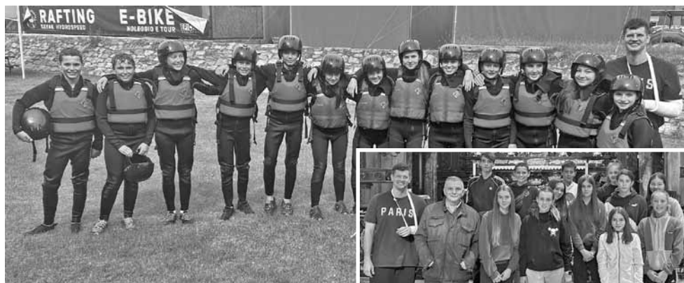
Sabato 14 settembre: alcuni ragazzi e ragazze delle secondarie hanno vissuto l'avventura del rafting sul fiume Adda e hanno fatto visita al santuario della Madonna di Tirano